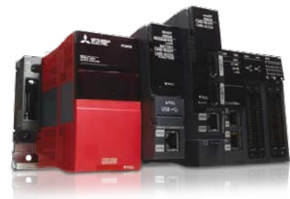
Несколько ЦП на одной внутренней шине