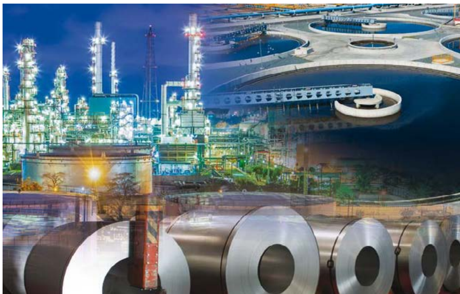
iQ Platform позволяет полностью интегрировать управление и связь.