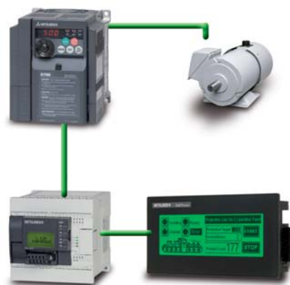
Точное управление двигателем по полевой шине

FX3G может работать как автономный контроллер, но, когда требуется интеграция с другими компонентами системы, ряд стандартных особенностей выделяет его среди прочих.