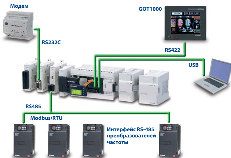
FX3G упрощает создание комплексных систем

Наконец, FX3G предоставляет широкий выбор опций, когда речь идет об организации сетей и связи: от поддержки стандартной связи по последовательным интерфейсам до всестороннего охвата распространенных открытых сетей автоматизации, включая CC-Link, CANopen, Profibus-DP и Ethernet. Кроме того, встроенный USB-порт позволяет удобно подключать ПК или ноутбук для высоко скоростной загрузки и выгрузки программ, а также мониторинга.