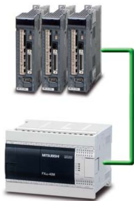
Непосредственное управление тремя сервоосями без дополнительного аппаратного обеспечения

В Mitsubishi разработаны стандартные инструкции, позволяющие просто управлять нашими преобразователями частоты по полевым шинам, обеспечивая точность и надежность.